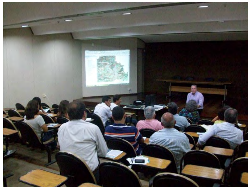
Reunião - 21/05/14