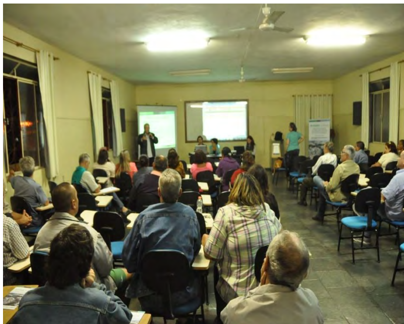
Oficina nas RP Norte e Centro-oeste - 24/04/14