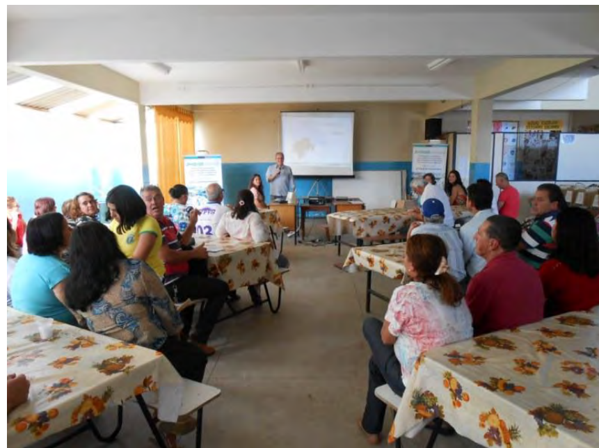
Oficina em Torreões - 23/08/14