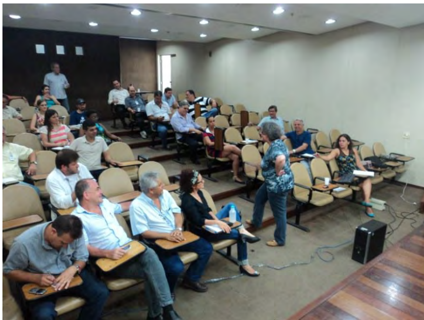
Reunião - 10/12/13