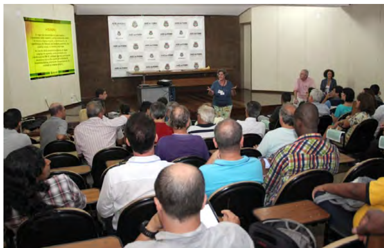
Assembleia Eletiva - 26/02/2015