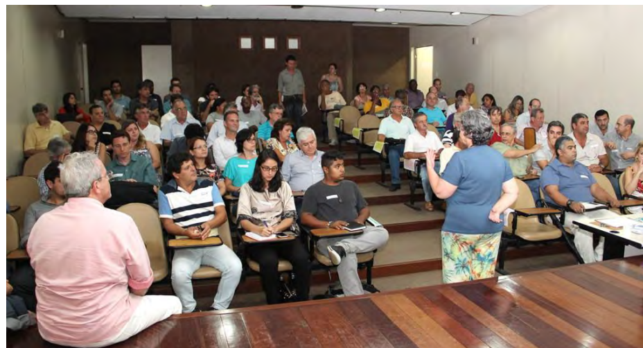
Assembleia Eletiva - 26/02/2015